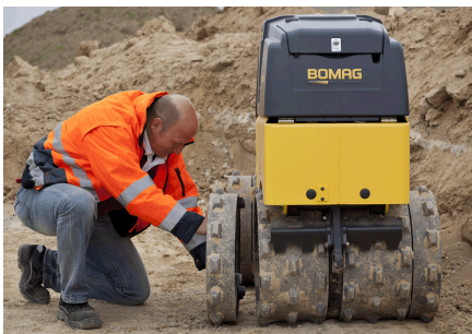
Larghezze di lavoro flessibili Allargamenti tamburo originali BOMAG