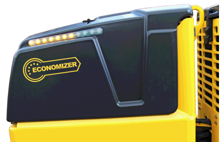
Più qualità, meno costi ECONOMIZER - Il display della compattazione (opzione)